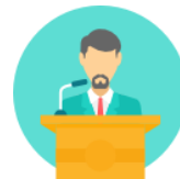
Лекция иностранного KOL